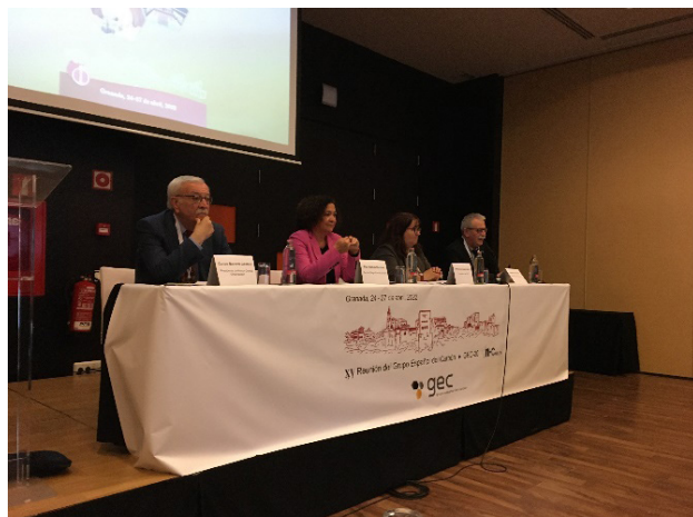
Acto de inauguración. Mañana del 25 abril.