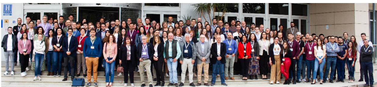
Asistentes a la XV Reunión del GEC. Granada, 26/04/2022

No quiero acabar esta reseña sin dejar constancia de nuestro más sincero agradecimiento, en primer lugar, a todos los participantes de la XV Reunión del GEC, por venir a Granada, por su compromiso con la misma en todas sus facetas, por la comprensión con los inconvenientes, por el cariño mostrado, porque somos GEC. Agradecemos a la Junta Directiva del GEC el soporte, la ayuda, y la confianza depositada en el Comité Organizador en todo momento. Y finalmente, gracias también a todos los estudiantes y visitantes del Grupo de Investigación en Materiales de Carbón de la UGR, que no figuran en el comité organizador, pero que sin su ayuda tampoco hubiera sido posible la celebración de esta Reunión. Gracias a todos.