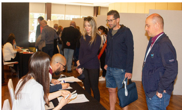
Recogida de documentación. Tarde del 24 abril.

Fue allá por 2018 cuando el Grupo de Investigación en Materiales de Carbón, de la Universidad de Granada, recibió el encargo para la organización de la XV Reunión del Grupo Español del Carbón (GEC-20). La presentación del mismo se llevó a cabo en Alicante, durante la celebración del CESEP de 2019, y las fechas elegidas fueron del 26 al 29 de abril de 2020. Puestos manos a la obra con mucha ilusión, estando ya el programa científico terminado, y las inscripciones pagadas nos sobrevino la pandemia, sus consecuencias, y tuvimos que suspender la Reunión. Esto implicó la cancelación de los acuerdos, precontratos y contratos con las empresas e entidades participantes, tanto del programa científico como social del GEC-20, así como la devolución de las cuotas, tarea administrativa singularmente tediosa. Hubo algunos intentos de reactivar el GEC-20, otoño 2020 y primavera de 2021, pero la inseguridad constante tanto desde el punto de vista sanitario, como jurídico-administrativo, nos hizo desistir. Finalmente, y de acuerdo con la Junta Directiva del GEC, cruzamos los dedos y nos lanzamos a una segunda aventura organizativa con vistas al 24 al 27 de abril de 2022, fechas en las que finalmente se pudo celebrar.