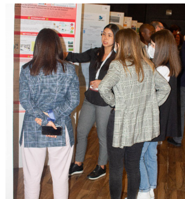
Sala de carteles.