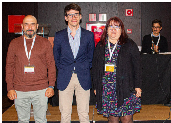
Ganador del Premio JJII-GEC.