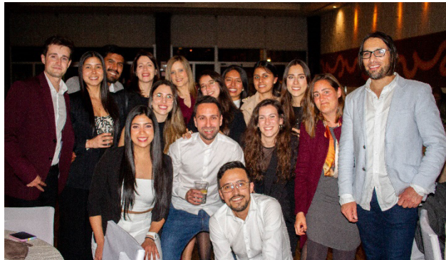
Cena de clausura. Noche del 27 de abril.