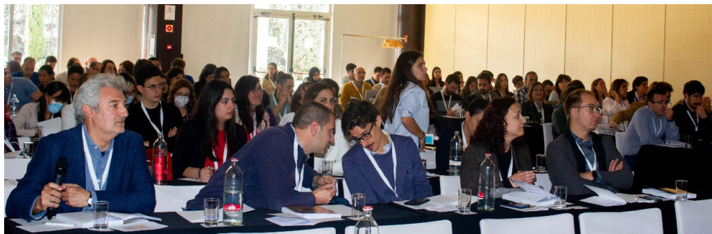
Sala de la reunión. Comunicaciones orales.