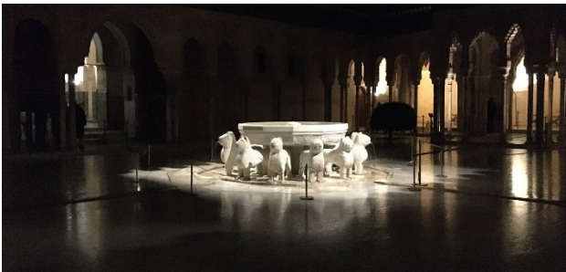
Patio de los Leones, Alhambra. Noche del 26 de abril.