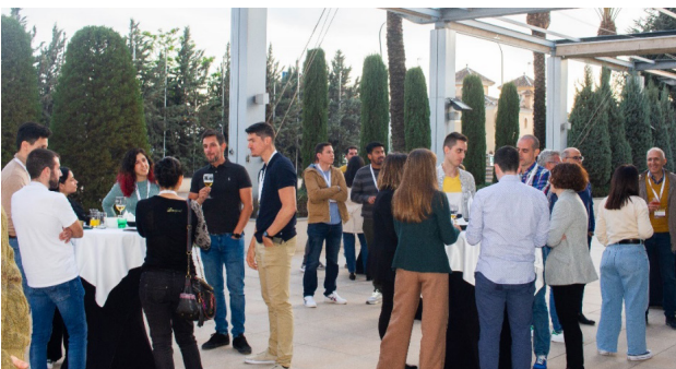
Cóctel de bienvenida. Tarde del 24 abril.

Comenzamos la tarde del 24 de abril de 2022, durante la cual la mayoría de participantes recogió la tradicional documentación de la Reunión, finalizando con un cóctel-cena de bienvenida en la sede de la XV Reunión del GEC, el Hotel Abades Nevada