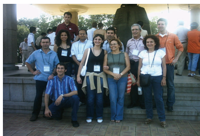
Asistentes españoles a la conferencia Carbon 2005 en Corea.

Finalmente, con el buen sabor de boca dejado por esta edición del 2005 se clausuró la conferencia, pasando el testigo a Aberdeen (Escocia), donde se celebrará la edición del 2006.