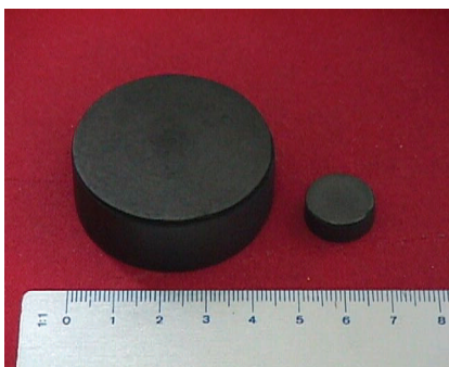
Figura 3. Monolitos de carbón activados (MCA) preparados a partir de un carbón activado químicamente y de un aglomerante comercial.

Como se ha mencionado, los monolitos se pueden preparar utilizando un aglomerante, el cual es un compuesto o mezcla de compuestos químicos, que ayuda a mantener unidas todas las partículas del carbón. Para esta aplicación específica, el aglomerante debe tener ciertas propiedades: (i) debe producir monolitos con propiedades mecánicas buenas utilizando la menor relación aglomerante/carbón activado posible, con el fin de no disminuir la capacidad de almacenamiento de metano y (ii) su pirólisis no debe producir un bloqueo de la porosidad del carbón activado. Esta última característica del aglomerante es muy importante, ya que el objetivo de su utilización es aumentar la densidad de empaquetamiento, mientras se mantiene un volumen de microporos lo más elevado posible. La Figura 3 contiene una fotografía de dos MCAs con distintas dimensiones preparados a partir de un carbón activado químicamente y utilizando un aglomerante comercial. La descripción detallada del proceso de preparación de estos monolitos, así como sus propiedades mecánicas y de adsorción se puede encontrar en la bibliografía [8,11]. Estos MCAs presentan una capacidad volumétrica de adsorción de metano de 140 V/V y un volumen de metano liberado de 126 V/V. La disminución de capacidad de almacenamiento de los monolitos respecto al CA en polvo es esperable debido a la existencia del aglomerante, el cual no presenta prácticamente capacidad de adsorción.