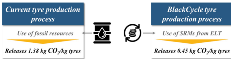
Figura 2. Comparación de la Huella de Carbono entre procesos de producción.

Al ofrecer una alternativa económica y ambientalmente viable, BlackCycle reducirá la exportación de neumáticos al final de su vida útil. Al reubicar la gestión y transformación de neumáticos al final de su vida útil dentro de la UE, se espera que BlackCycle cree empleos sostenibles dentro de la UE.